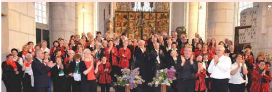
Le groupe vocal Crescendo de La Ferrière.