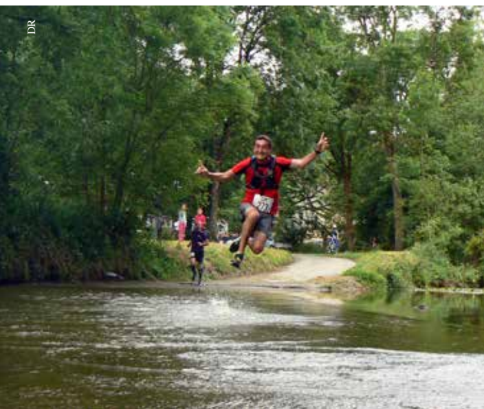
La traversée de l'Yon, un classique de la Marath'yonnaise.

Retrait des dossards (épinglé à prévoir) à la maison de quartier de la Vallée-Verte, entre 7 h 30 et 9 h pour les 12 et 24 km, de 7 h 30 à 9 h 15 pour les 5 km. Renseignements pratiques et inscriptions disponibles sur marathyon85.fr