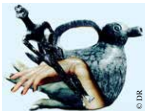
Œuvre d'Alice Dourlen.

La Gâterie donne carte blanche à Alice Dourlen. Une artiste aux multiples facettes (musicienne, collagiste, dessinatrice) qui réalise ses œuvres à partir de ses « obsessions ». Nourrie de ses rêves et de son imaginaire, elle évoque en images