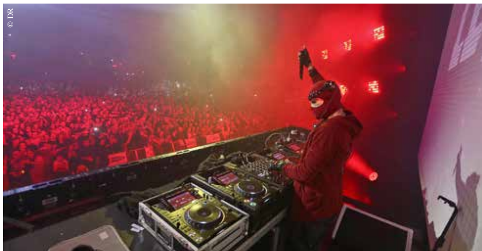
Sound of Legend.

● Parc Expo des Oudairies - La Roche-sur-Yon, de 21 h à 3 h Contact : Facebook @hsvendee