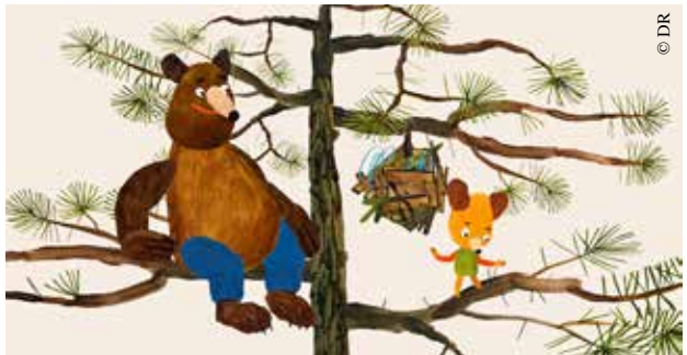
Les Ours gloutons.

● Ciné-goûter le jeudi 16 avril, à 14 h 30.