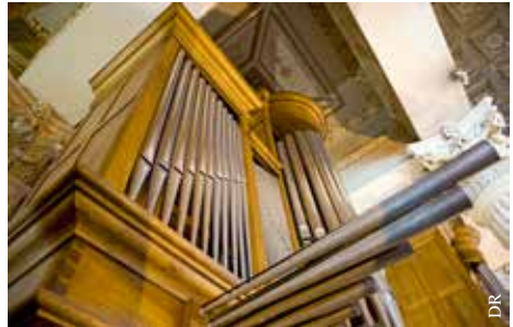
L'orgue Koenig de l'église Saint-Louis.

Créé en 2014, l'Ensemble Les Cantates Spirituelles est constitué de musiciens professionnels de la région nantaise spécialisés dans l'interprétation de la musique baroque. À géométrie variable selon les répertoires abordés, il se produit régulièrement à Nantes et rassemble ses membres autour de Cantates de Bach et Buxtehude. Il est également invité dans divers festivals à travers la France en plus