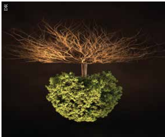
Voyage sous nos pieds.

Ouvert à tous les jardiniers, cet atelier vous permettra de vous familiariser avec la