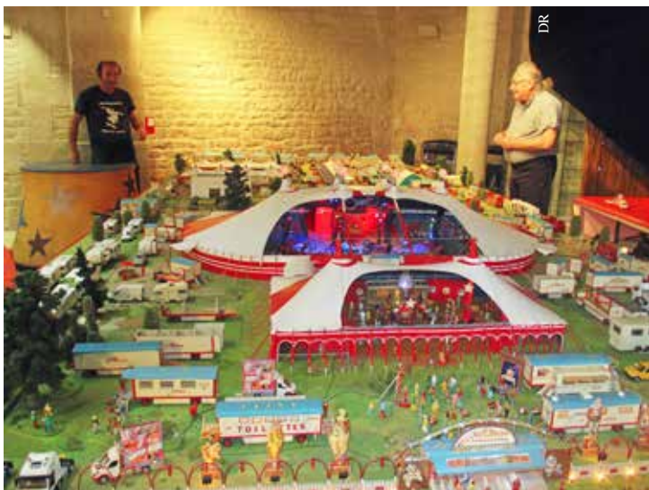
Des maquettes de cirques de toutes les tailles.