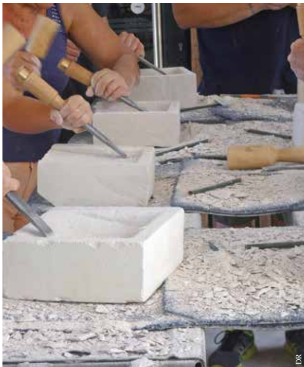
Initiez-vous à la taille de pierre.