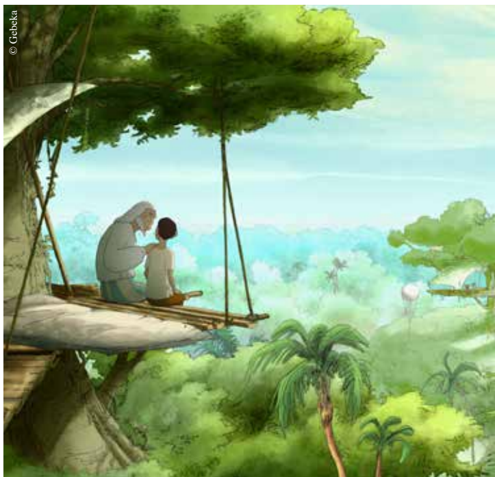
Le Voyage du Prince.

● Le Manège – La Roche- sur-Yon, à 10 h 30