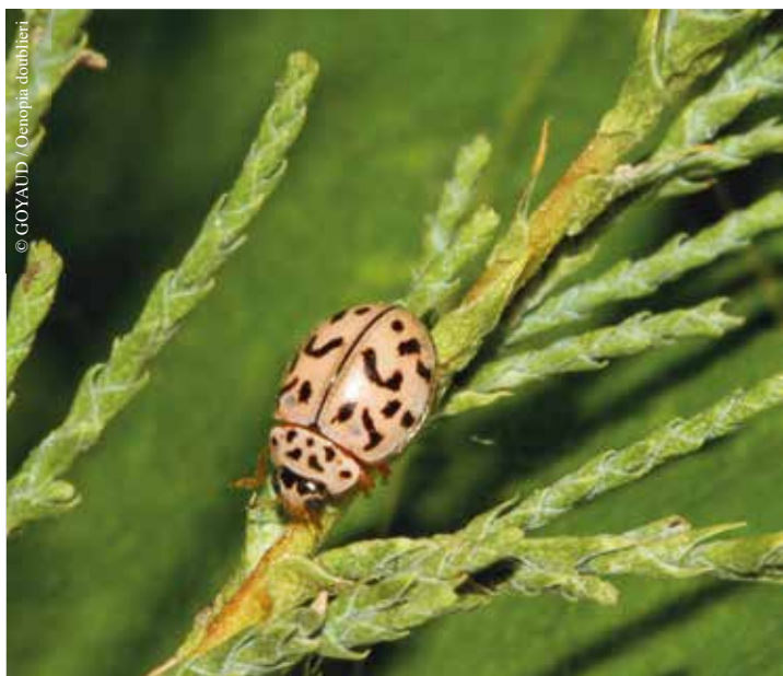
Exposition « Coccinelles ».

Avec les mêmes outils qu'au Moyen Âge, venez vous initier à la gravure avec Thibault, tailleur de pierre dans la vallée de l'Yon. Les motifs végétaux seront à l'honneur : fleurs, feuilles, lianes viendront orner vos pierres dans un style art nouveau qui mêlera artisanat et modernité.