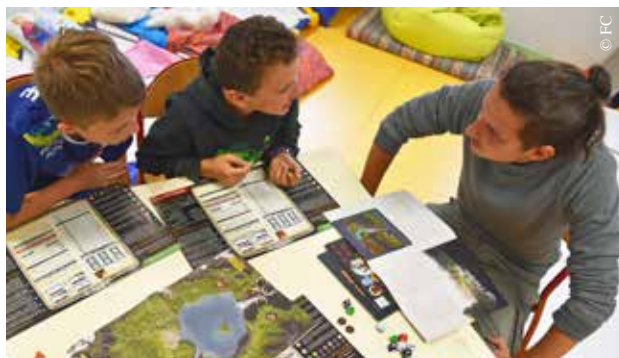
Les principes du jeu de rôle sur table expliqués aux plus jeunes.

● Maison de quartier de Saint-André d'Ornay, chemin Guy-Bourrieau – La Roche-sur-Yon