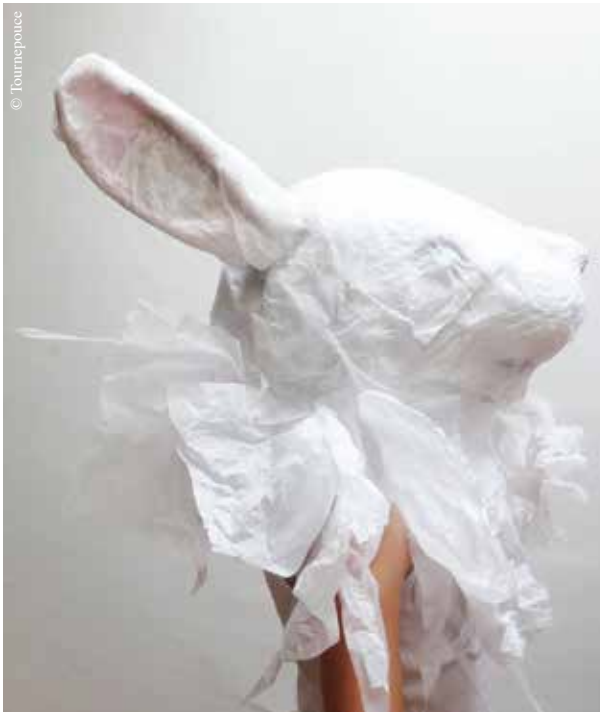
Sous la neige.