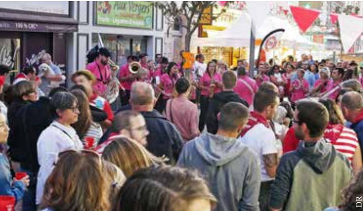
La feria anime tout le quartier des Halles.

● La Casa del Porrón, 25, rue des Halles – La Roche-sur-Yon, à partir de 16 h Contact : 02 28 15 45 53