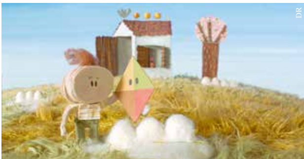
Un petit air de famille.

● Cinéma Le Concorde, 8, rue Gouvion – La Roche-sur-Yon Contact : 02 51 36 50 22 et sur www.cinema-concorde.com