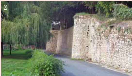
Les ruines des remparts du château à La Chaize-le-Vicomte.