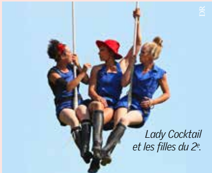
Lady Cocktail et les filles du 2 e .

Soirée de lancement du festival Méli Mel'arts avec le spectacle de la compagnie Lady Cocktail.