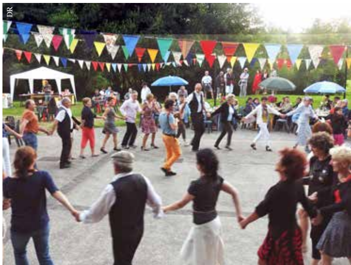
Guinguette à Moulin Sec.