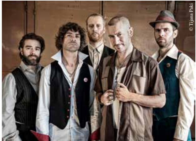
La Caravane passe.

Suzane se définit elle-même comme une « conteuse d'histoires vraies sur fond d'électro ». Électron libre de cette nouvelle scène électro/chanson, Suzane étouffe les évidences et chante ce que nous sommes. Avec plus de 90 dates, des tournées au Japon et en Chine, Suzane continue sa formidable ascension ! Attention : OVNI !