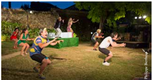
Les Esquisses investissent le jardin des Compagnons.

● Jardin des Compagnons, rue Saint-Hilaire – La Roche-sur-Yon, à 21 h Contact : 02 51 36 26 96, www.lementeurvolontaire.com , @lementeurvolontaire