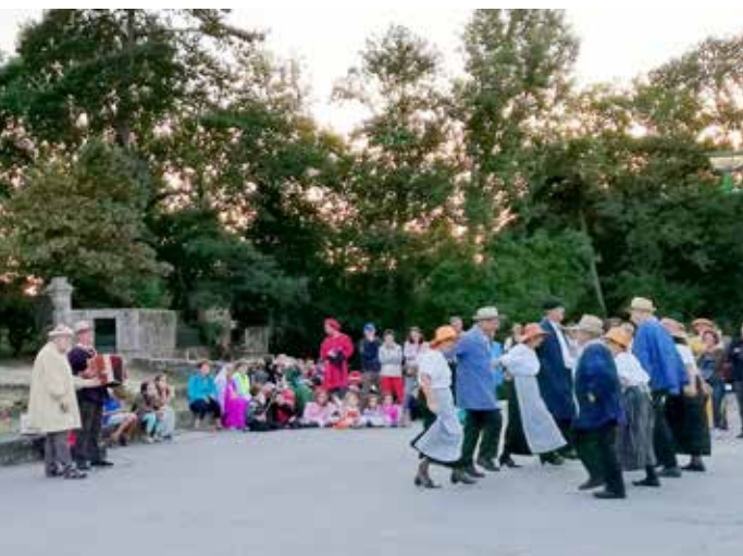
Danses folkloriques au programme des animations.

● Départ salle Ronsard, espace culturel des Grands Maisons, le vendredi 19 juillet, rassemblement à 20h, et le vendredi 23 août, rassemblement à 19 h 30 – La Chaize-le-Vicomte Contact : 02 51 05 72 09