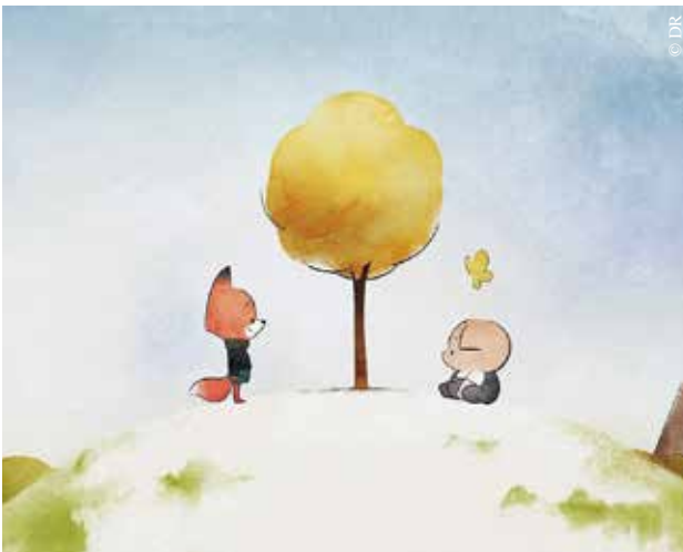
Ariol prend l'avion !