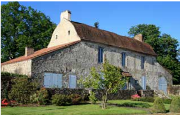
Maison Jeanneton possède un toit caréné à l'impériale, en coque de navire inversée – 1825.

● Espace culturel des Grands-Maisons, salle Ronsard – La Chaize-le-Vicomte, le vendredi 3 août