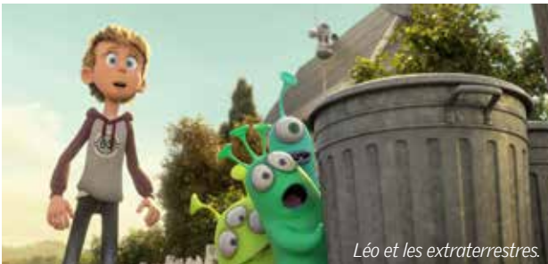
Léo et les extraterrestres.

● Cinéma Le Concorde, 8, rue Gouvion – La Roche-sur-Yon Contact : 02 51 36 50 22 et sur www.cinema-concorde.com