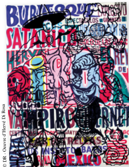
© DR - Oeuvre d'Hervé Di Rosa