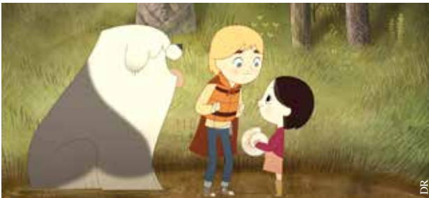
Le Chant de la mer.

● Cinéma Le Concorde, 8, rue Gouvion – La Roche-sur-Yon Contact : 02 51 36 50 22 et sur www.cinema-concorde.com