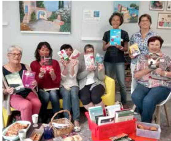
Les membres du café lectures.

● Îlot des arts, 1, place de La Billardière – Venensault, à partir de 10 h 30 Contact : 02 51 48 19 36,