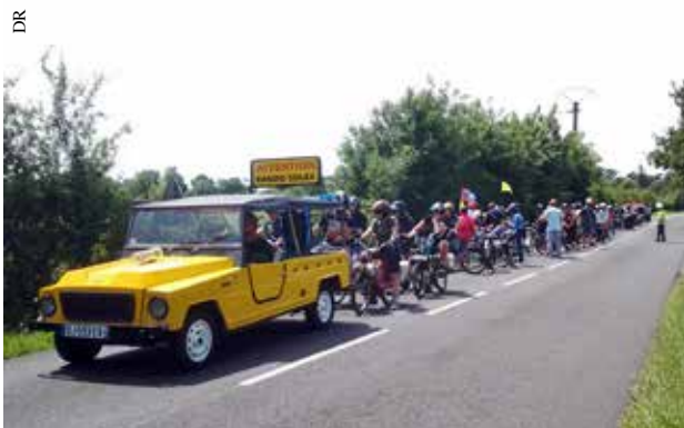
La Solexarde parcourra les routes du territoire.