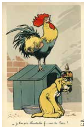
Caricature de Benjamin Rabier.