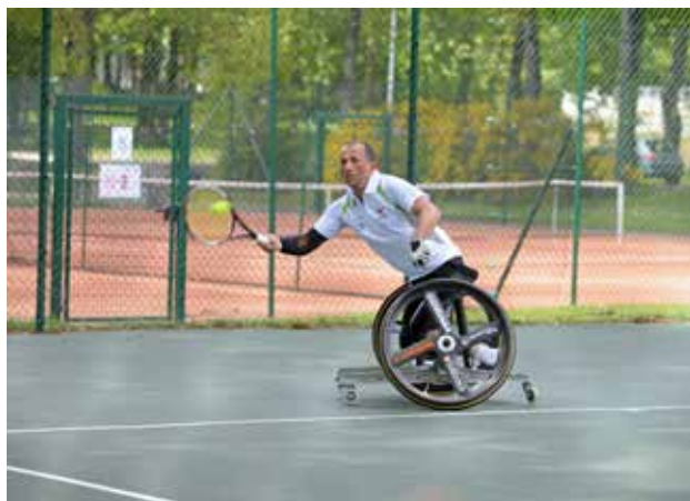
Open de tennis handisport : quatrième tournoi français !

● Complexe sportif des Terres-Noires – La Roche-sur-Yon