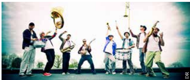
La fanfare « Out of Nola ».

La soirée, de 20 h 30 à 22 h 30, sera animée par la fanfare « Out of Nola » :