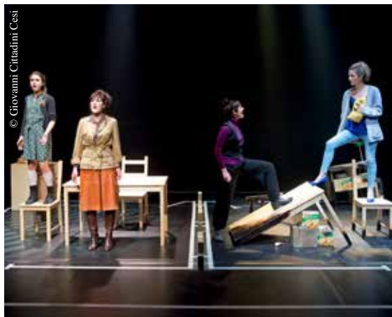
Sur les cendres en avant : pièce de théâtre chantée.

À la fois sombre et joyeux, déjanté et poétique, lyrique et swing, cet ovni théâtral délicieusement féministe est tout simplement réjouissant.