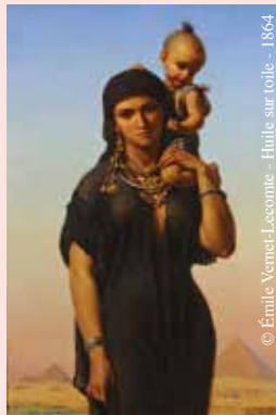
Femme fellah portant son enfant.