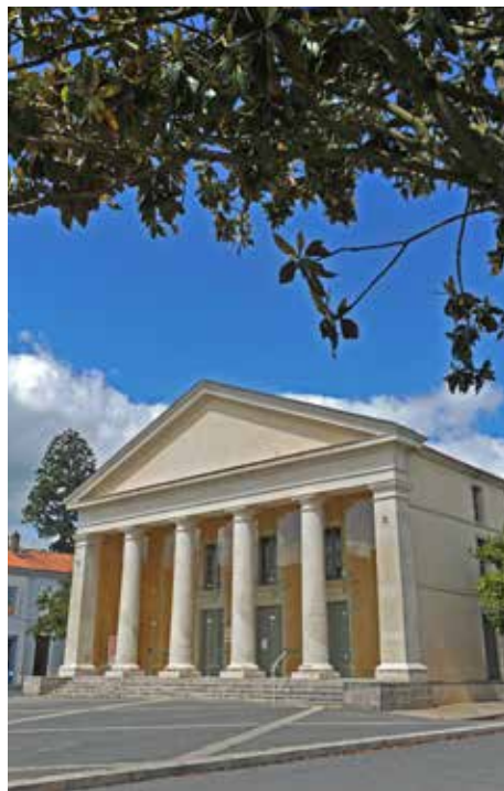
Le Théâtre à l'italienne.

La construction de l'église Saint-Louis s'étend de 1813 à 1829, bien après la mort de Napoléon. Elle remplace l'église Saint-Hilaire, située dans l'ancienne ville et qui ne convient plus au nouveau chef-lieu. Avec son plan inspiré des basiliques romaines, son décor à l'antique et son mobilier dessiné par les Ponts et Chaussées,