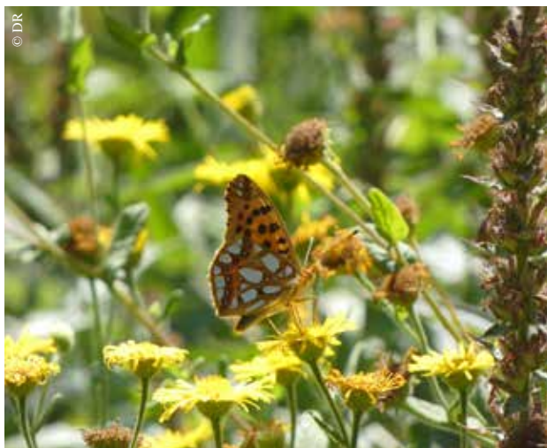
Partez à la découverte des papillons.

● Quartier du Val d'Ornay – La Roche-sur-Yon, de 10 h à 11 h 30 Réservation obligatoire auprès de la maison de quartier, au 02 51 47 36 63, viequartier@amaqy.fr