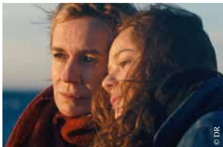
Voir le jour.

● Cinéma Le Concorde, 8, rue Gouvion – La Roche-sur-Yon www.cinema-concorde.com