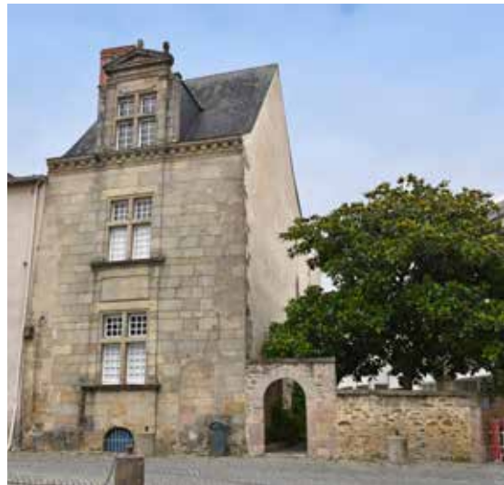
La Maison Renaissance.

● 7, rue Jeanne d'Arc – La Roche-sur-Yon Contact : 02 51 46 06 04