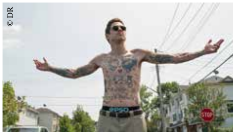
The King of Staten Island.