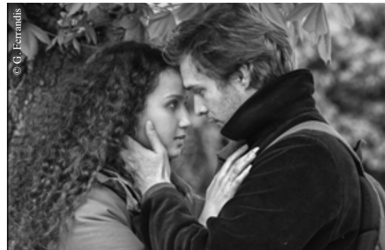
Le Sel des larmes.

Un jeune provincial, Luc, qui monte à Paris pour passer le concours d'entrée à l'école Boule. Dans la rue, il y rencontre Djemila avec qui il vit une aventure. De retour chez son père, le jeune homme retrouve sa petite amie Geneviève alors que Djemila nourrit l'espoir de le revoir. Quand Luc est reçu à l'école Boule, il s'en va pour Paris, abandonnant derrière lui sa petite amie et l'enfant qu'elle porte.