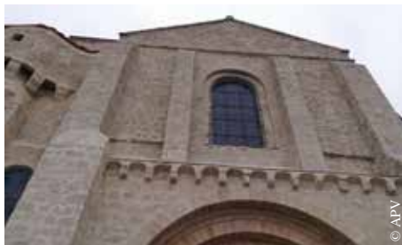
L'église Saint-Nicolas de La Chaize-le-Vicomte.

● Église Saint-Nicolas – La Chaize-le-Vicomte, à 17 h 30