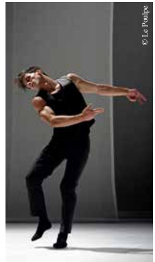
R, trois tableaux pour un danseur.