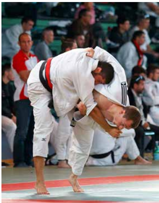
Judokas de niveau national et international s'affronteront le 2 octobre.

Contact : Judo club yonnais, 93, rue du Président-de-Gaulle, au 02 51 37 51 62 et sur www.jcy.fr