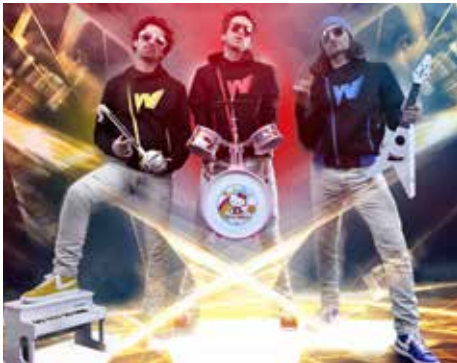
Les Wackids : mini-instruments, maxi show !

Hey, petits écoliers ! Fermez vos cahiers, rangez vos cartables et tenez-vous prêts... Les Wackids, trois super-héros du rock, plongent le jardin de la mairie dans une ambiance de stade enflammée !