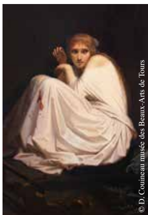
© D. Coineau musée des Beaux-Arts de Tours

Envie de frissons ? Ne manquez pas l'exposition « Visages de l'effroi – Violence et fantastique de David à Delacroix » organisée en collaboration entre le musée parisien de la Vie romantique, Paris-Musées et le musée de La Roche-sur-Yon.