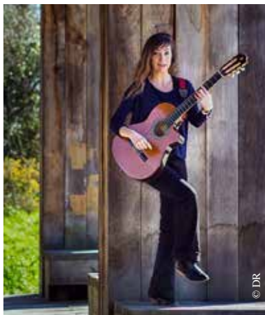
Lodie, des chansons françaises fraîches et dynamiques.