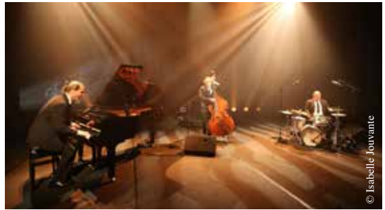
Les Voilà Voilà font swinguer petits et grands.

● Jardin des Compagnons, rue Saint-Hilaire – La Roche-sur-Yon, à 19 h