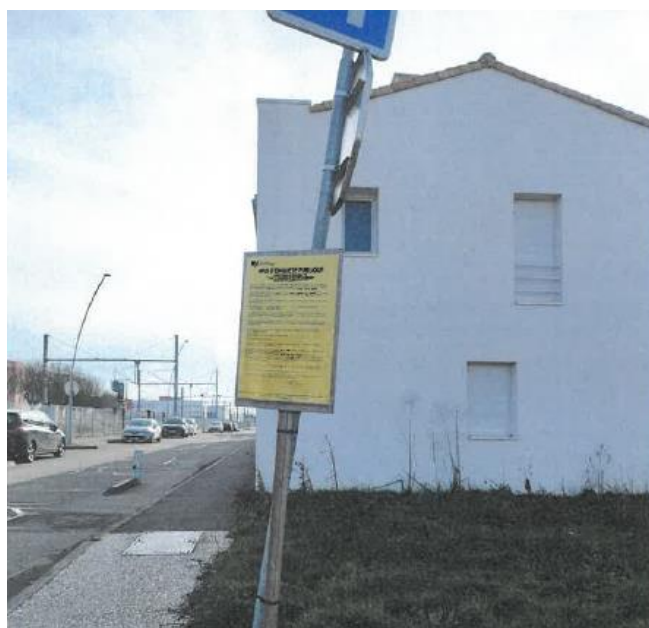
Allée de la Minoterie, rue des Cheminots et rue Pierre SEMARD