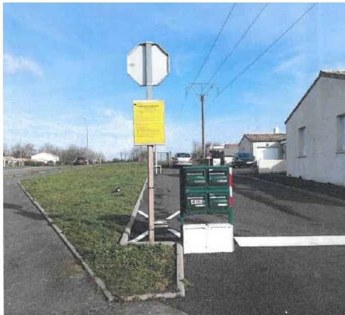
rue Guy TRAJAN