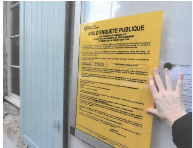
Mairie annexe St André d'Ornay