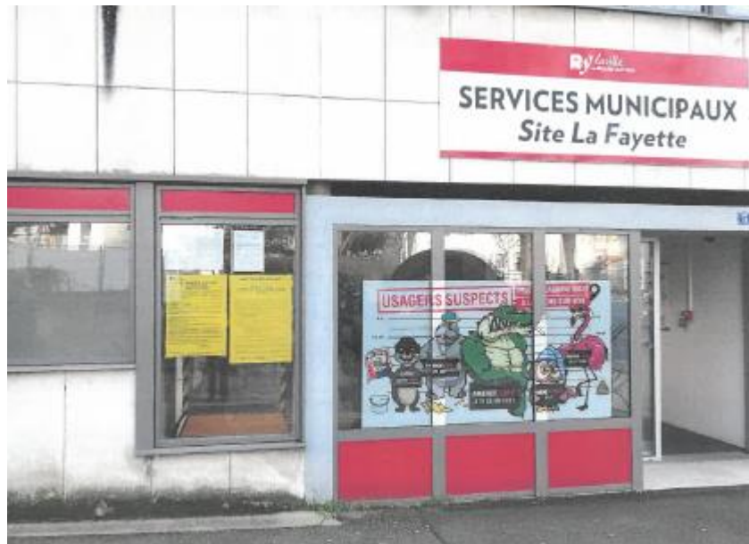
Siège de l'enquête : Rue LAFAYETTE