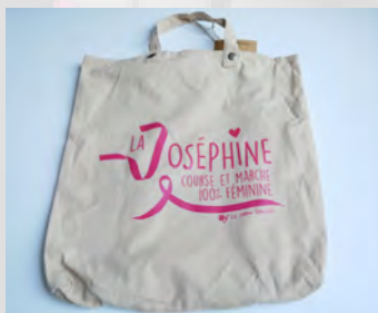
TOTEBACK SAC À DOS 12 €