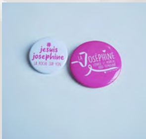
BADGES 3,8 ET 5 CM 0,50 ET 1 €