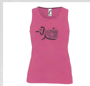
DÉBARDEUR 12 €