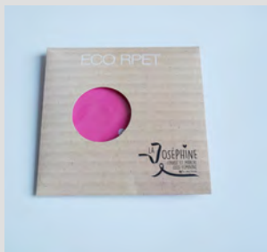
FOULARD TOUR DE COU 6 €