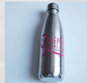
GOURDE EN ACIER 14 €