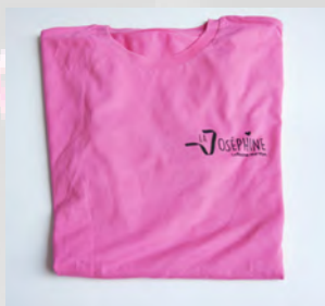
TEE-SHIRT 14 €

En 2021, 505 objets dérivés ont été vendus, soit 1 617,98 € reversés à la Ligue contre le cancer.