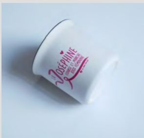
MUG CÉRAMIQUE 7 €