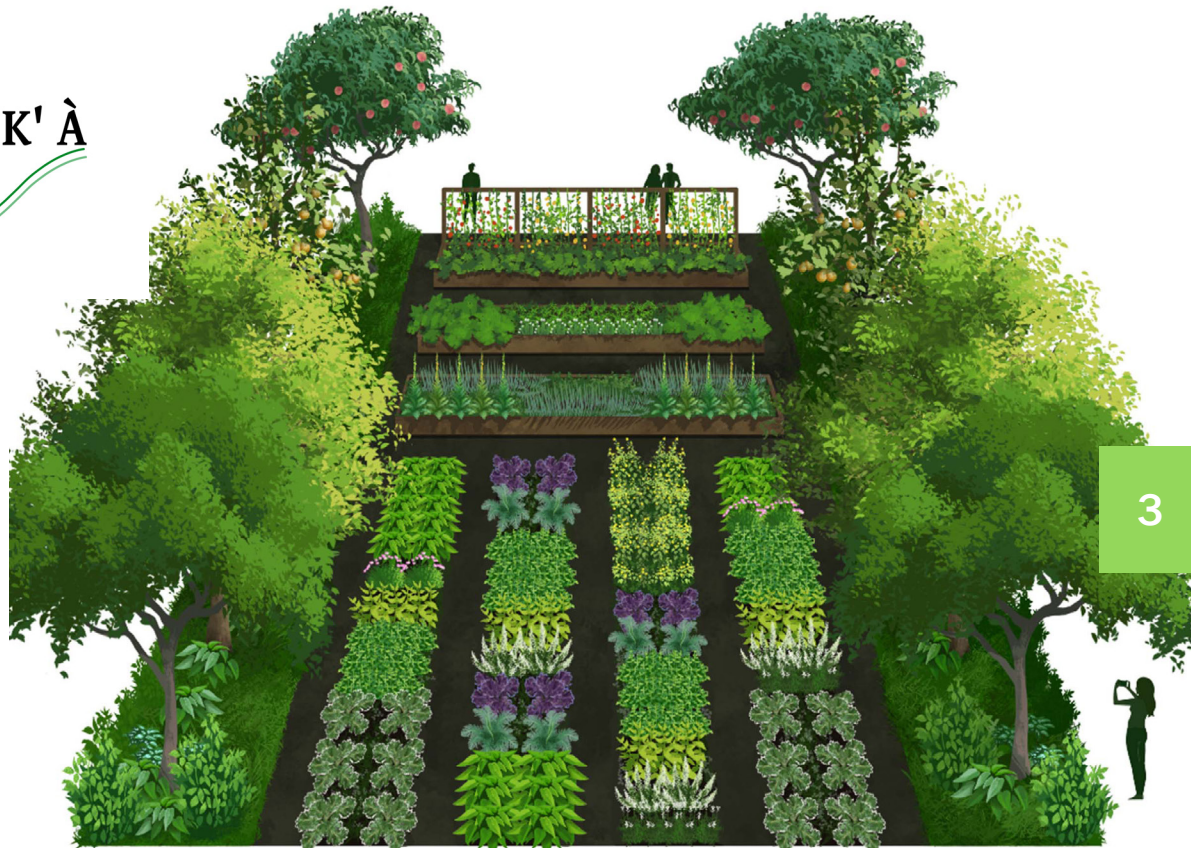
visuel d'illustration de la future exploitation agricole