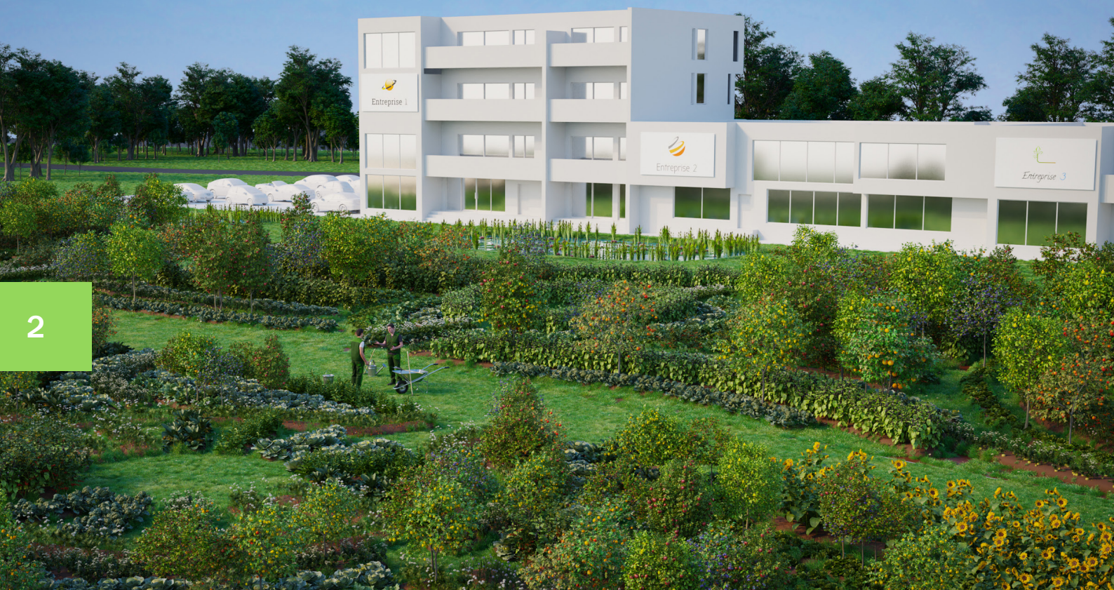
visuel d'illustration de la future exploitation agricole