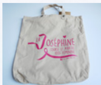
TOTEBACK SAC À DOS 12 €