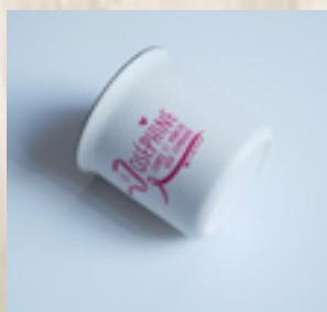
MUG CÉRAMIQUE 7 €