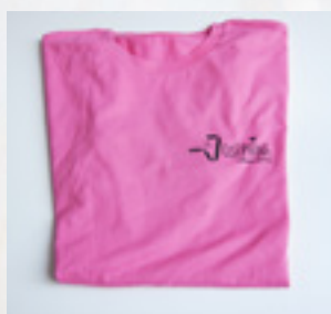
TEE-SHIRT 14 €

Pour cette 7 ème édition, la Ville a choisi d'apporter une touche de nouveauté à l'événement en proposant la création d'une boutique éphémère. Un dépôt-vente est ainsi proposé au sein de la boutique de l'Office du tourisme du 25 septembre au 16 octobre, où différents objets seront mis en vente. Les bénéfices seront reversés à la Ligue contre le cancer de Vendée.