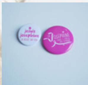
BADGES 3,8 ET 5 CM 0,50 ET 1 €