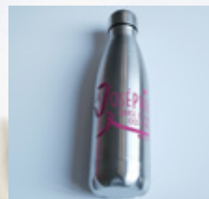
GOURDE EN ACIER 14 €