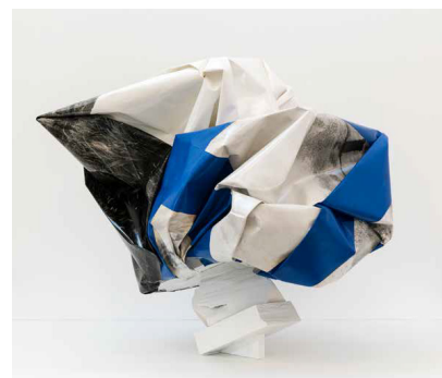
Pains de Sucre Bivalve II, 2017, volume photographique, oilbar bleu céruleum sur tirage baryté et tirage baryté,