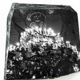
Les Âmes (Ermitage) Sibérie - St Léger, 2014-2016 (volume photographique, gélatine argen- tique, volume en bois massif - dimensions variables, 21 x 27 x 7 cm environ)