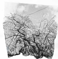
Mue Hanami II, et Hanami III Gélatines argentiques sur papier BFK Rives, encadrées 70 x 70cm