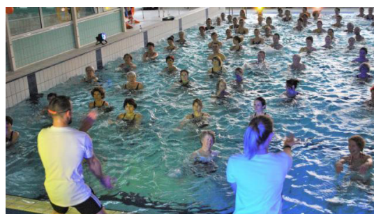
Atelier bien-être «aquagym»

Les fonds récoltés par La Joséphine vont aussi permettre pour les prochaines années :