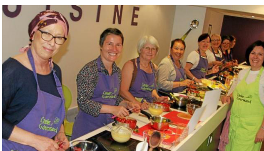
Atelier bien-être «cuisine»

Parmi les activités proposées, les participants ont pu découvrir : l'A.P.A (Activité Physique Adaptée), la danse Nia, la relaxation, la réflexologie plantaire, le Shiatsu Do In, le modelage créatif, l'aquarelle, le Qi Gong, la balade des 5 sens, l'art thérapie, le karaté santé, la sophrologie, l'auto hypnose, l'aquagym, le yoga, l'art floral, la méditation, la sono thérapie, la cuisine, le journal de vie, le pilates, l'estime de soi, la marche nordique, le canoë, le bien être Feldenkrais, les couleurs intuitives & calligraphie, l'anti-stress par la couleur, les ateliers créatifs. À La Roche-sur-Yon, sont également proposés : un atelier karaté santé et une pratique adaptée du canoë en équipage «Ramer contre le cancer».