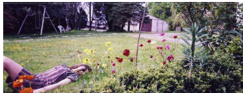
Daniel Challe « Clémentine »

L'artothèque propose également une collection de 500 livres d'artistes, une des plus importantes de la région, à consulter sur demande et sur place.