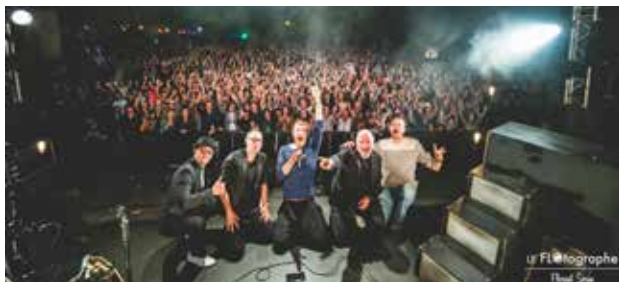
Ambiance garantie au festival Pay ta Tong.

L'association des Espadrilles vous invite à la seizième édition du festival Pay ta Tong. C'est gratuit !