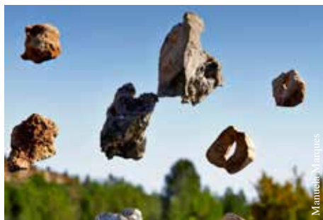
Déplacement (2016) impression pigmentaire sur papier.

Le projet des musées de Lodève et de La Roche-sur-Yon s'inscrit dans un travail mené dans le paysage à partir de dispositifs photographiques qui jouent sur les illusions d'optique et sur