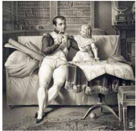
● Musée – La Roche-sur-Yon Contact : 02 51 47 48 35