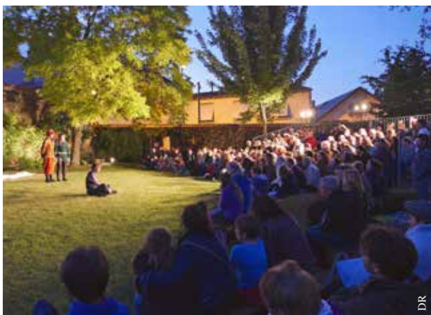
Les élèves des Z'ateliers présentent leurs travaux au public.

● Jardin des Compagnons, rue Saint-Hilaire – La Roche-sur-Yon, à 20 h