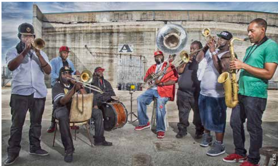
La fanfare funk The Hot 8 Brass Band.