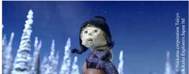
© Nikkatsu corporation Taiyo Kikaku Explorers Japan Ltd

Collectif – 38 min – Rép. Tchèque, Japon. Il n'y a bien que les adultes pour penser que les bonshommes de neige restent dans le jardin en attendant sagement de fondre ! Dès que les grands ont le dos tourné,